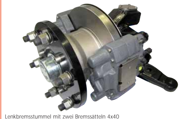
Lenkbremstummel mit zwei Bremsätteln 4x40