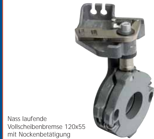
Nass laufende Vollscheibenbremse 120x55 mit Nockenbetätigung