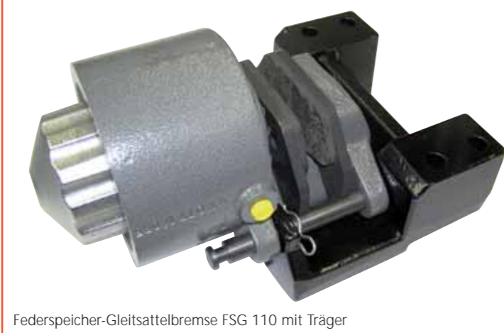
Federspeicher-Gleitsattelbremse FSG 110 mit Träger

Knott Bremsen überzeugen durch ihre perfekte Anpassung an Flurförderzeuge. Dies führt zu • hoher Belastbarkeit • konstanter Leistung • hoher Bremswirkung und hohem Bremskomfort • langer Lebensdauer • vorbildlicher Wartungsfreundlichkeit