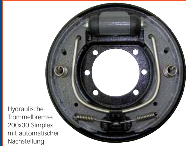
Hydraulische Trommelbremse 200x30 Simplex mit automatischer Nachstellung

Knott kann sich aus gutem Grund als der Spezialist für Bremsen und Bremssysteme für alle Arten von Staplern bezeichnen. Denn bei Knott wird jede Bremse mit dem Kunden zusammen genau für die Anforderungen des jeweiligen Fahrzeugeinsatzes entwickelt. Allein die Einsatzbedingungen und die Anforderungen an das jeweilige Gerät entscheiden über Prinzip, Aufbau und Leistung der Bremse bzw. des Bremssystems. Dabei ist Knott auf mittlere bis kleine Serien spezialisiert.