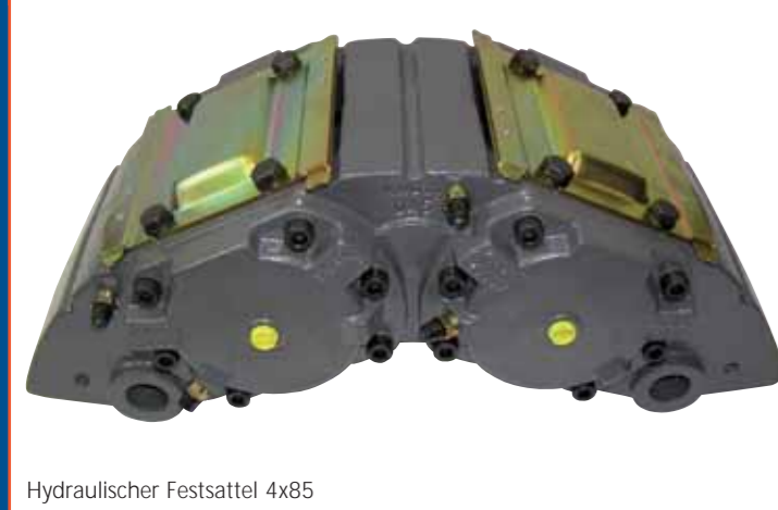
Hydraulischer Festsattel 4x85