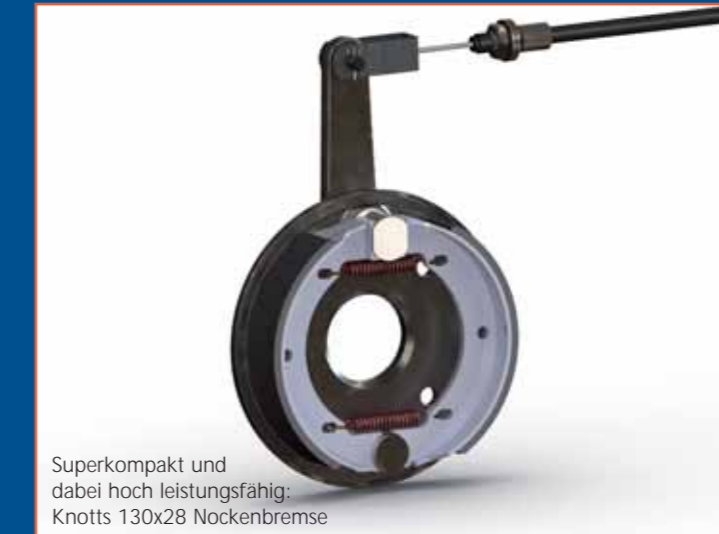
Superkompakt und dabei hoch leistungsfähig: Knotts 130x28 Nockenbremse